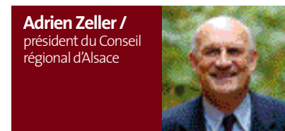
Adrien Zeller / président du Conseil régional d'Alsace

“ Avec le tramway, nous changeons d'époque, nous passons de la ville pour la voiture à celle des transports publics. Le tram a transformé les autoroutes urbaines qu'étaient devenus les grands axes en des espaces partagés entre tram, vélos, piétons et voitures. Il a embelli la ville.”