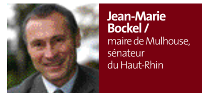
Jean-Marie Bockel / maire de Mulhouse, sénateur du Haut-Rhin