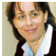
Fabienne Keller / maire de Strasbourg, sénatrice du Bas-Rhin

“ La mise en service du TGV Est ouvre une nouvelle « route européenne » entre la façade atlantique et l'Europe centrale. Ce sera un formidable moyen d'accéder rapidement à Strasbourg et à l'espace rhénan, à la beauté de ses cités et de ses trésors artistiques.”