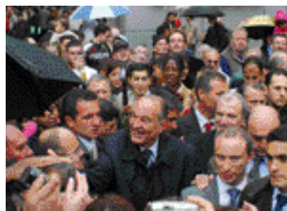
Inauguration le 20 mai - Jacques Chirac et Jean-Marie Bockel prennent un bain de foule parmi les habitants venus nombreux malgré la pluie.