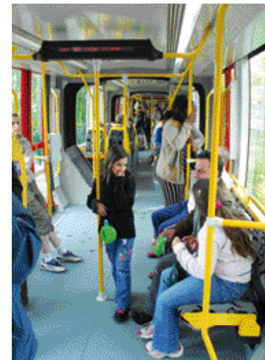
À bord du tram - Le lancement du tramway sera progressif du 13 mai jusqu'au 5 juillet, date de mise en service de l'ensemble du nouveau réseau.

“ Le tram-train constitue pour la SNCF une réponse innovante aux nouveaux besoins de déplacements générés par la périurbanisation et la congestion des plus grandes agglomérations. Véritable système intégré de transport, il permet de passer d'une allure prudente en zone urbaine à une vitesse pouvant aller jusqu'à 100 km/h sur le réseau ferré national. C'est un formidable outil d'aménagement du territoire qui répond aux enjeux actuels du transport public.”