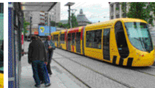
En station - À chaque station, de nombreux habitants se pressaient pour essayer leur nouveau tram, heureux de pouvoir enfin en profiter. Ainsi, dans la seule journée du 13 mai, près de 70 000 visiteurs l'ont emprunté...