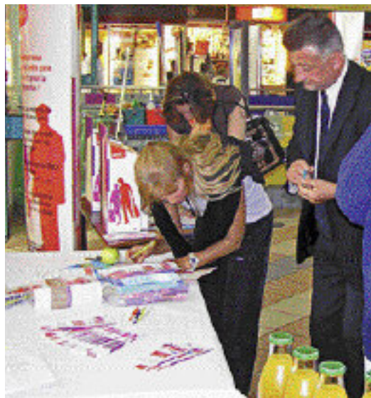
Semaine européenne de la mobilité - Les chefs de gare sont allés à la rencontre des clients.

“ Il est satisfaisant de constater que la SNCF engage une semblable démarche. Nous espérons que ses déclinaisons régionales viendront compléter efficacement le plan de progrès régional adopté en juin 2007, qui vise à améliorer la ponctualité (objectif : 91 % en 2007), l'information des clients et la propreté des trains et des gares.”