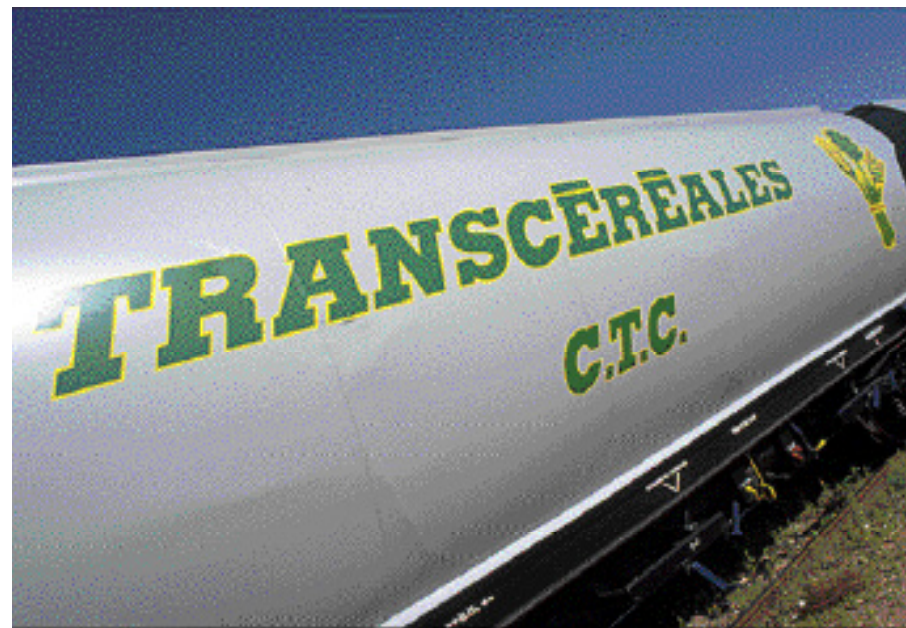
Les hauts débits sont particulièrement adaptés aux grands flux industriels et agricoles.

La Bourgogne vient de connaître une intéressante expérience de « haut débit » ferroviaire avec l'acheminement des céréales produites dans la région vers le port de Fos-sur-Mer. La SNCF assure désormais deux allers et retours par semaine avec une seule rame, donc une augmentation importante des capacités de transport. Pour cela, il a fallu, en collaboration avec le client, optimiser les opérations de chargement et de déchargement (depuis onze silos et à Fos-sur-Mer), programmer l'utilisation des machines et des conducteurs, bref, tout prévoir.