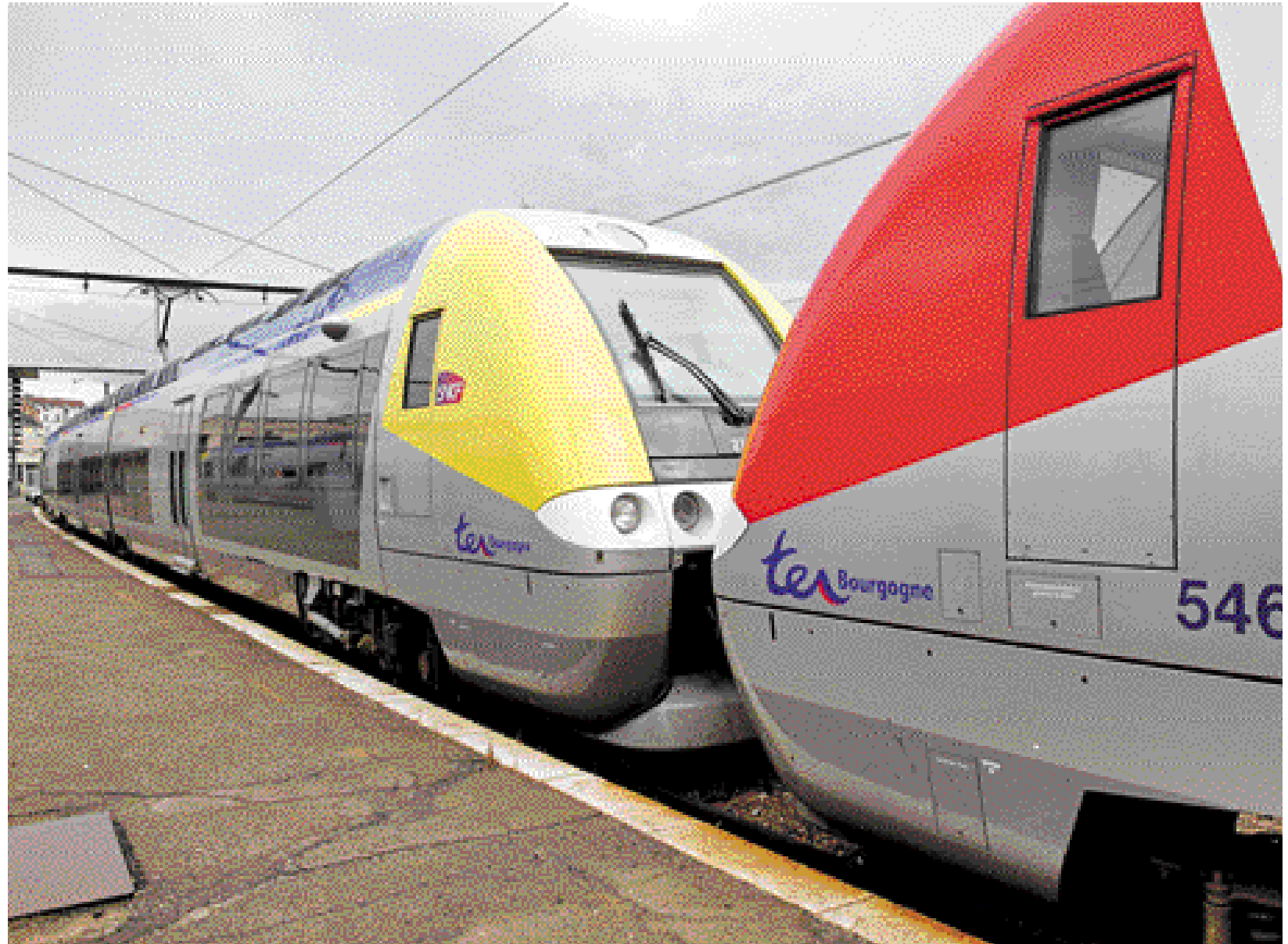
Les rames réversibles , équipées d'une cabine de pilotage à chaque extrémité, permettent d'éviter les manœuvres en gare.

“ Nous sommes tout à fait satisfaits de l'augmentation du trafic voyageurs en gare de Chagny. Elle va permettre aux habitants de notre ville de six mille habitants d'avoir accès plus facilement aux services fournis par les centres plus importants que sont Dijon, Beaune, Chalon, Mâcon et Lyon.”