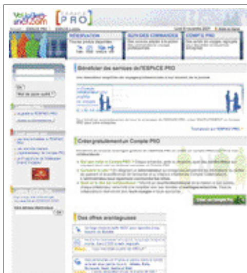
La clientèle professionnelle a aussi son espace dédié sur le Web avec l'Espace Pro.

L'offre de loisirs n'est pas oubliée. Par exemple, le prix d'appel de Prem's sur TGV et TéoZ a baissé de 3 euros, et le nombre de destination Prem's a augmenté de 37 %. Les voyageurs qui disposent aujourd'hui d'un tarif Découverte profitent désormais de cinq niveaux de réduction – au lieu d'un seul auparavant – qui évolue en fonction de la date d'achat. C'est dire qu'il s'agit d'une prime à l'anticipation :