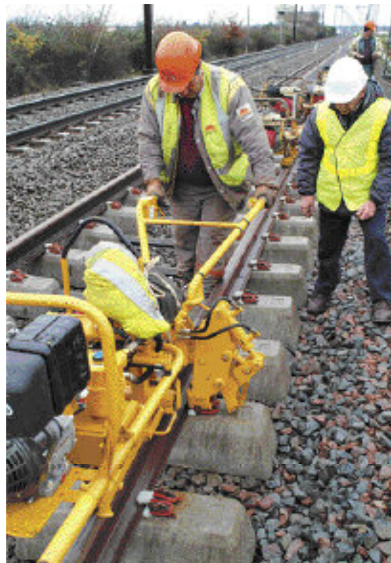
Les travaux réalisés sur la ligne historique Paris-Bruxelles s'inscrivent dans le cadre du renouvellement des voies et du ballast.

temporaires de circulation à contresens ont été mises en place. Réalisés de jour à une cadence de 900 à 1 000 mètres par jour, les travaux ont mobilisé cinq cents personnes dont cent cinquante cheminots. À leur issue, 42 kilomètres de voie, 31 500 tonnes de ballast et 36 000 traverses ont été renouvelés pour un coût à peine supérieur à 23 millions d'euros. Un autre RVB sur 4 kilomètres de la ligne Creil-Beauvais est en cours. Enfin, l'année s'achèvera avec le renouvellement des aiguillages de la gare de Saint-Quentin. Prévoyant un effort financier en faveur de la rénovation du réseau en passant de 1 milliard d'euros par an à 1,6 milliard d'euros en 2010,