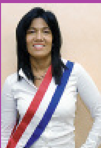
SAMIA GHALI, sénateur maire des 15 e et 16 e arrondissements de Marseille et vice-présidente du Conseil régional PACA

« C'est une bonne chose que les jeunes du quartier aient contribué à la réalisation de la fresque d'embellissement de la halte SNCF TER de Saint-Joseph-Le Castellias. Chaque fois que l'on peut associer les habitants dès leur plus jeune âge, nous constatons une meilleure appropriation des lieux et un plus grand respect des installations. Ces actions peuvent aussi aider les jeunes à se découvrir d'autres motivations. »