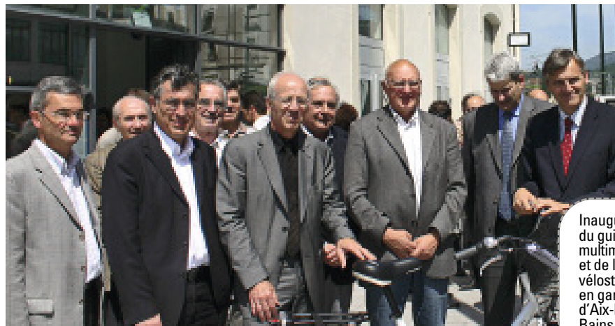
Inauguration du guichet multimodal et de la vélostation, en gare d’Aix-les-Bains.

“Je suis très heureuse d’être la nouvelle directrice de la SNCF en Rhône-Alpes. Originaire de Savoie, je connais bien cette région et je l’aime. En dix ans, le TER Rhône-Alpes a évolué de façon impressionnante. Sous l’impulsion du Conseil régional, quelque 1 250 trains et 600 cars circulent chaque jour avec un taux de régularité supérieur à 90 %. Les cheminots sont fiers de relever quotidiennement ce défi. Toutefois, des progrès restent à faire, et l’amélioration de l’information aux voyageurs, bien que complexe à mettre en œuvre, reste ma priorité pour 2009. D’autres chantiers d’envergure sont à l’ordre du jour, dont notamment la mise en service de la nouvelle gare Jean Macé, à Lyon, celle du tram-train dans l’Ouest lyonnais, les travaux du sillon alpin ou le projet de RER franco-valdo-genevois (CEVA) entre Annemasse et Genève. Les projets sont nombreux, mais aussi passionnants et déterminants pour l’avenir de notre région. Là aussi, je sais pouvoir faire confiance à toutes les équipes de la SNCF, à leur professionnalisme, à leur efficacité pour atteindre et concrétiser ensemble ces différents objectifs.”