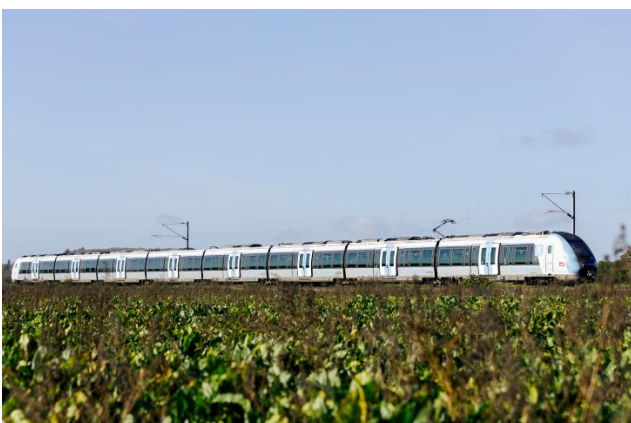
Francilien – Ligne P

L'arrivée du Francilien sur une ligne se traduit par un saut de performance, ces rames Francilien ont déjà fait leurs preuves en termes de fiabilité, de robustesse et de ponctualité notamment sur les lignes de Paris Saint-Lazare (Ligne L et Ligne J) et les lignes de Paris-Nord (Ligne H et Ligne K) avec 93% à plus de 95% de ponctualité cumulée à mi année 2022. En effet, le Francilien présente de meilleures performances d'accélération, de freinage et de fiabilité. Il dispose d'équipements anti-enrayage particulièrement utiles en automne pour s'adapter aux conséquences des « feuilles mortes ». Dispositif particulièrement utile sur cette branche de la Ligne P qui traverse de nombreuses zones boisées. L'augmentation de la largeur des portes, fluidifient les montées et descentes des voyageurs éliminant ainsi les facteurs de potentiels retards en gare.