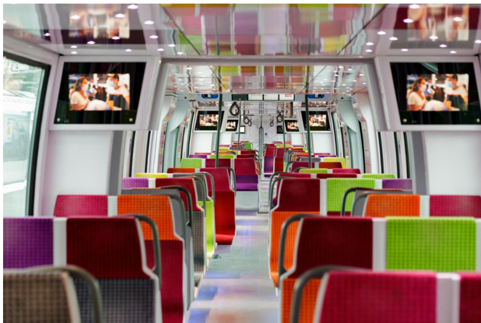
Francilien – Ligne P

Le Francilien offre 29% de sièges en plus (944 places assises en composition longue contre 732 avec les trains AGC) permettant une meilleure répartition en cas d'affluence. Ces trains dits « Boa » permettent de se déplacer sans encombre d'un bout à l'autre de la rame afin d'avoir une vue d'ensemble sur les places disponibles et/ou pour recevoir les informations utiles à la poursuite du voyage.