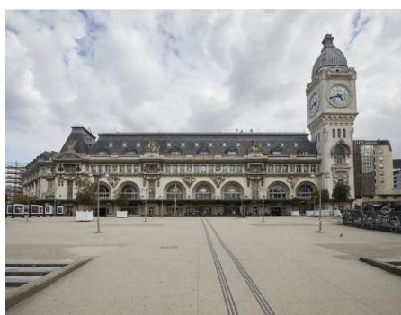
La Tour de l'Horloge