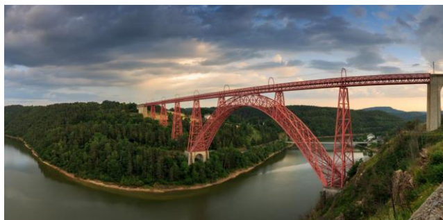
Le Viaduc de Garabit